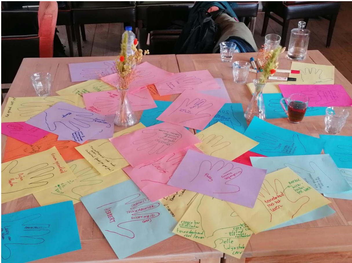
Figuur 2: Kennismaken (o.b.v. methode Hand Stencil Mandala )