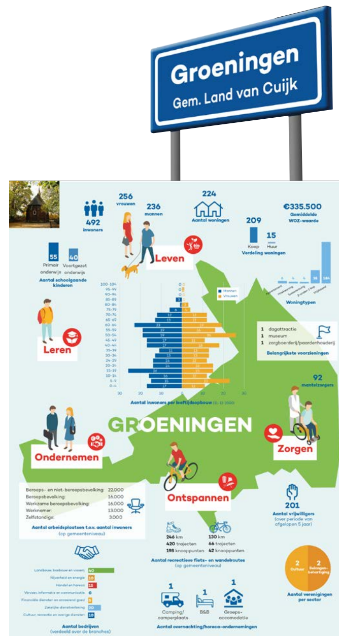
Factsheets Kernen CV's Groeningen

Ook Groeningen is een kern waar de inwoners in een gemoedelijke sfeer en prettig met elkaar leven. Er is een grote mate van saamhorigheid; inwoners en ook ondernemers helpen elkaar. Het Gilde, het Groenings Koor en de Dorpsraad zijn zeer betrokken en actief. Ze organiseren veel activiteiten. Karakteristiek voor het dorp is de St Antonius en St Nicolaaskapel aan De Schans; een monumentale bakstenen kapel uit de 15de eeuw. Sinds Café de Zandpoort is gesloten, zijn de inwoners en verenigingen nu aangewezen op de te kleine ruimte van het Gilde. Het Gildehuis zal binnenkort worden verbouwd tot dorps huis voor de Groeningse gemeenschap. Voor andere voorzieningen zijn de inwoners van Groeningen aangewezen op (met name) Vierlingsbeek. De kinderen gaan naar de basisschool in Vierlingsbeek of Vortum-Mullem. Dit wordt allerminst als probleem ervaren.