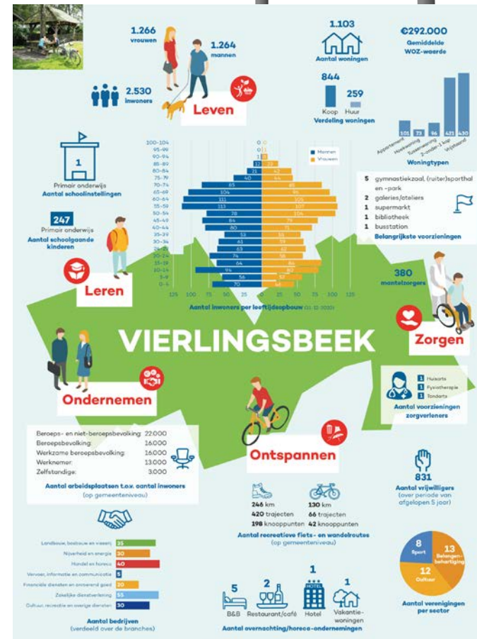
Factsheets Kernen CV's Vierlingsbeek